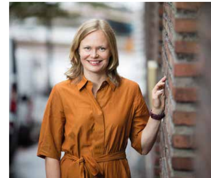
Kulttuuriministeri Hanna Kosonen